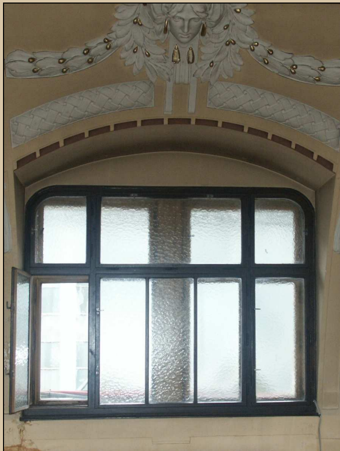
celkový pohled z interiéru