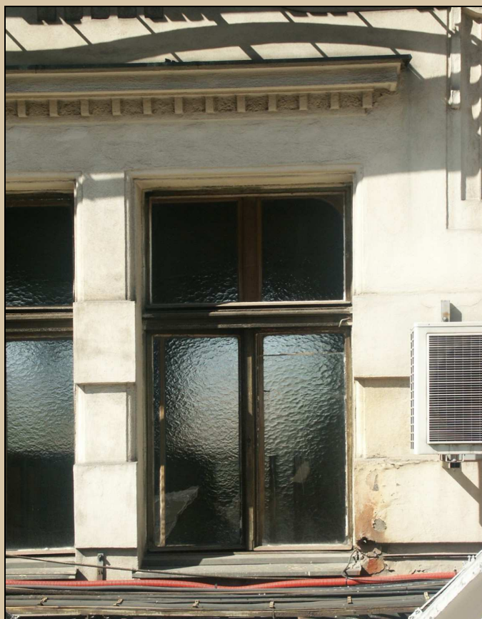
celkový pohled z exteriéru na jedno okno