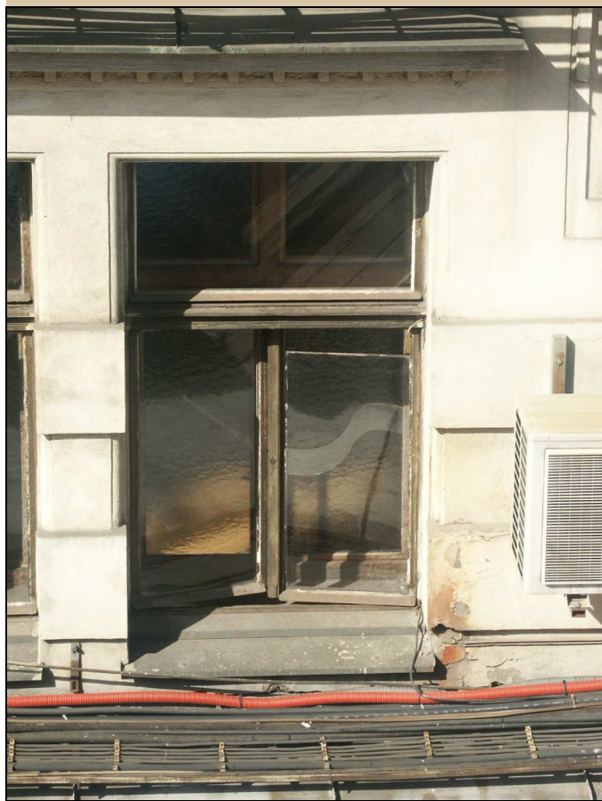
celkový pohled z exteriéru na jedno okno