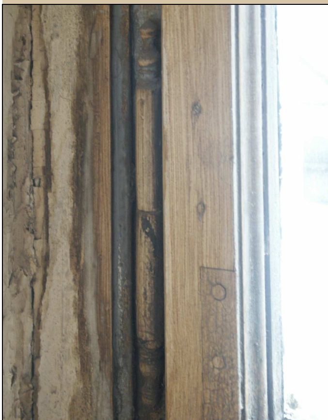
okenní závěs, původní povrchová úprava