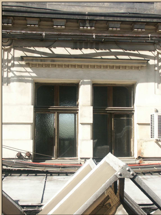
celkový pohled z exteriéru na dvě okna